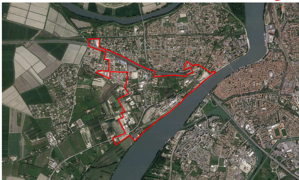
▭ Périmètre du site "CIF économique - Zone Ouest" : 106,4 ha environ