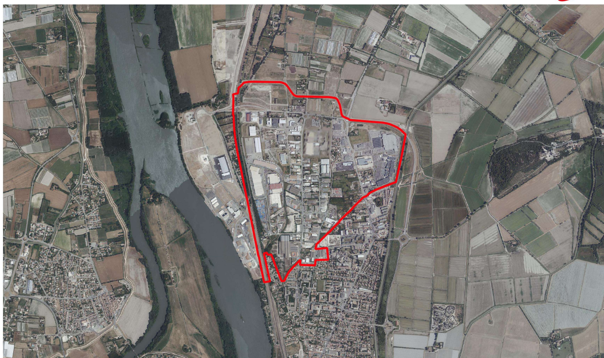
▭ Périmètre du site "CIF économique - Zone Nord" : 195,9 ha environ